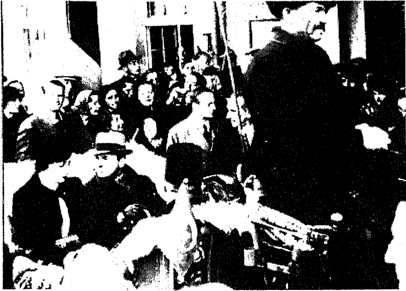
الملك فاروق يجلس بجوار أمه الملكة نازلي في أول رحلة ملكية . . داخل عربة مكشوفة . . ويظهر في الصورة وراء السائق أحمد حسنين باشا .